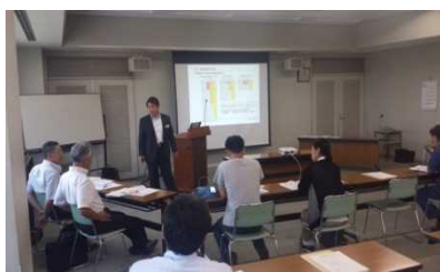
ワークショップ風景(イメージ)

滋賀県では、東京海上日動火災保険(株)の全面協力の下、「BCPワークショップ」を開催します。参加事業者の皆様は、半日の講座を受講いただけます。